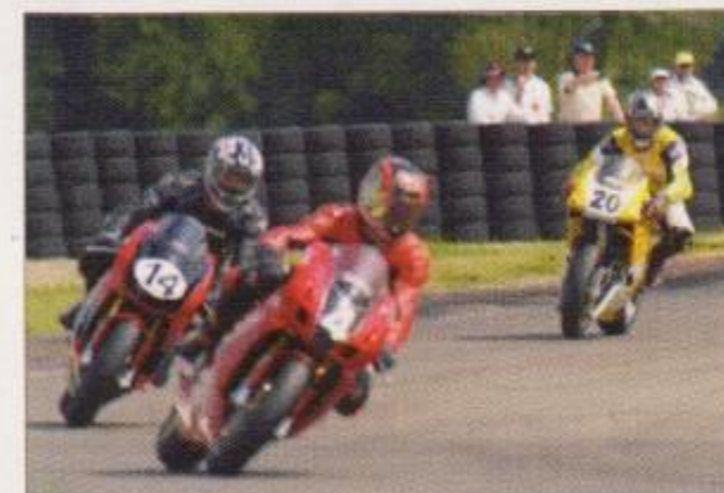
Arsoille dans le paquet, heureusement par une température moins caniculaire que les jours précédents.

Pas de tirage au sort pour prendre le départ, je suis