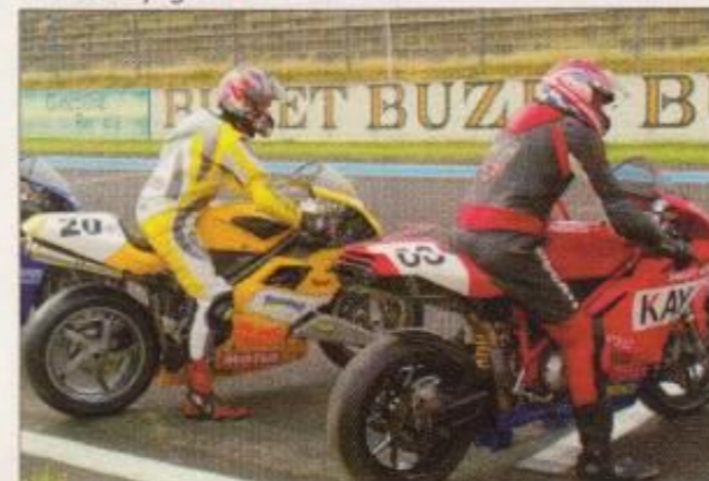
Sur la grille de départ, où il y a du beau monde !

zième position. Ça nous convient parfaitement, sachant qu'aux impressions des pilotes, il sera facile de tenir largement ce rythme régulier en course sans se fatiguer. La moto est précise, maniable, motrice bien et freine fort.