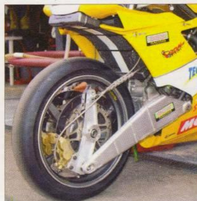
Le train avant, dont on distingue nettement tous les composants et le fonctionnement.

Samedi matin, première qualif pilotes blancs 8 h 30,