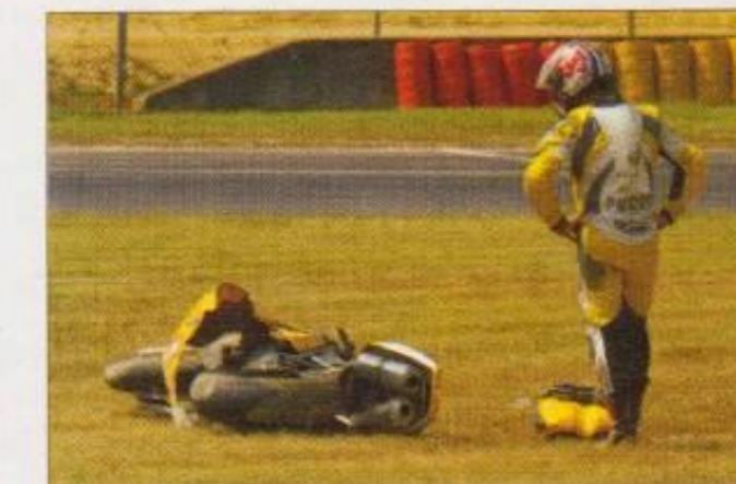
Un look inhabituel pour une Ducati sur l'angle... Impossible de confondre la Twister avec une autre Bolonaise !

Pierre JUYON - 682, rue de Cacheliron 40170 LIT-ET-MIXE Tél./fax : 05.58.42.77.17 - Mobile : 06.07.23.96.24 E-mail : pierre.juyon@wanadoo.fr http://perso.orange.fr/twister-concept/